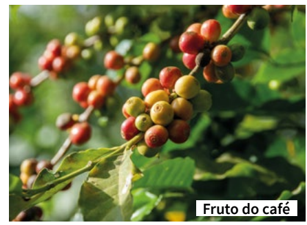
Fruto do café